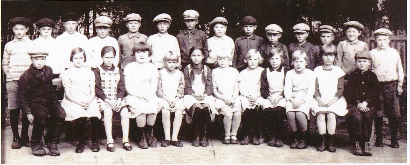
Yläsommen yläkansakoulu syksyllä 1929 luokat 3 ja 4.